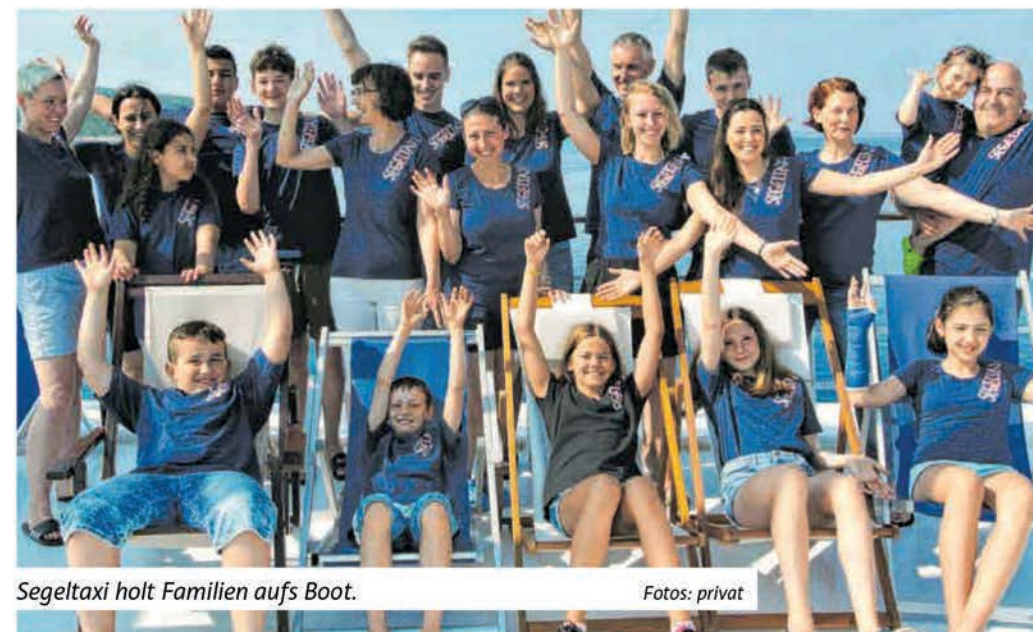
Segeltaxi holt Familien aufs Boot.